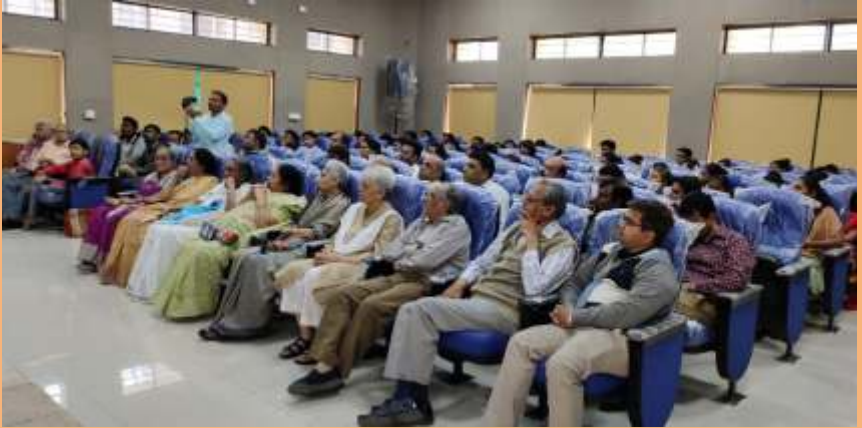
સ્મારક પ્રવચનમાં પ્રતિષ્ઠિત પ્રેક્ષકો